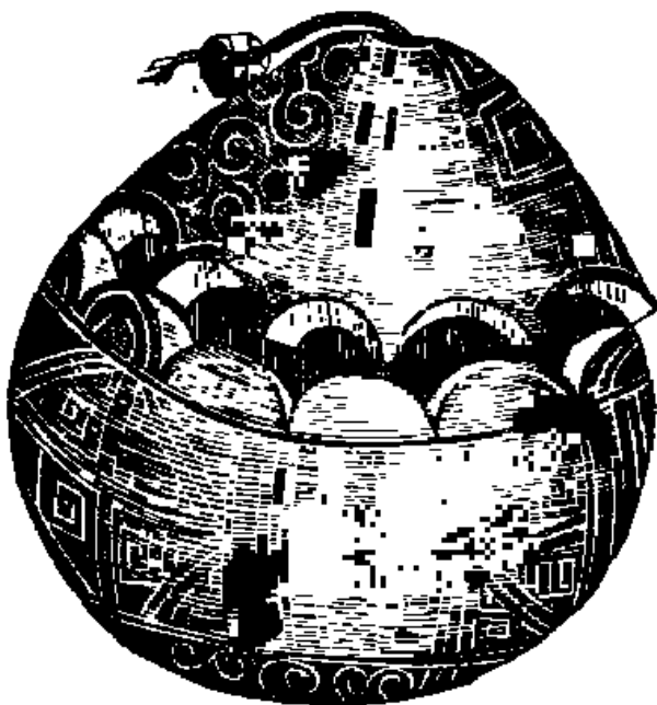
Scatolino del Payaguan.

lo, con una greca bianca che spiccava sul fondo nero. Io lodai con calore quella giovane artista, ed essa, messasi all'impegno di far presto e di far meglio, finì in pochi momenti l'opera sua, e me la porse con un piglio d'ingenua compiacenza. Io l'accettai, e le diedi in cambio pochi soldi.