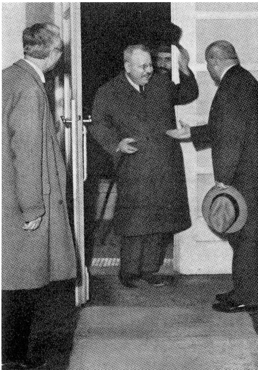
3. Lugano: Benedetto Croce accolto da Arminio Janner e Delio Tessa.