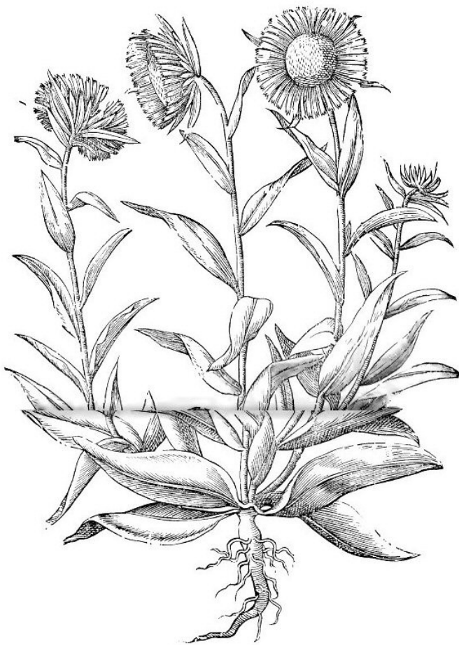
Asteris attici species, Incensaria (Tom. I, carta 256 dell'Erbario Aldrovandi).