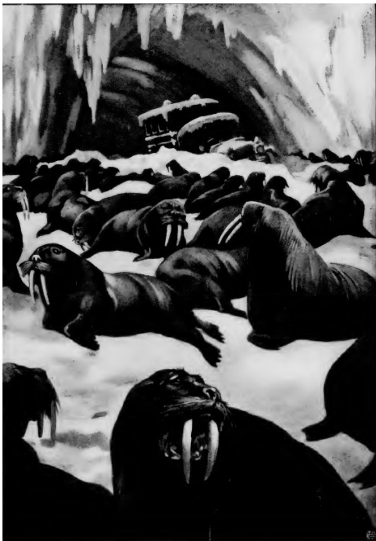
Erano delle morse , chiamate anche trichechi , e dagli esquimesi: awak . (Cap. XVII).