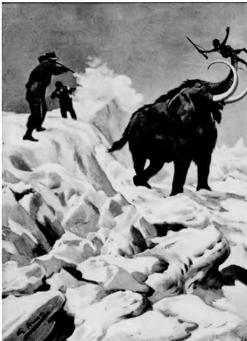
Il mammoth , spaventato da quelle detonazioni.... (Cap. XXIII).