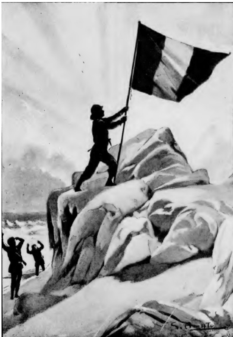
Il canadese volle andar solo ad inalberare la bandiera... (Cap. XXV).