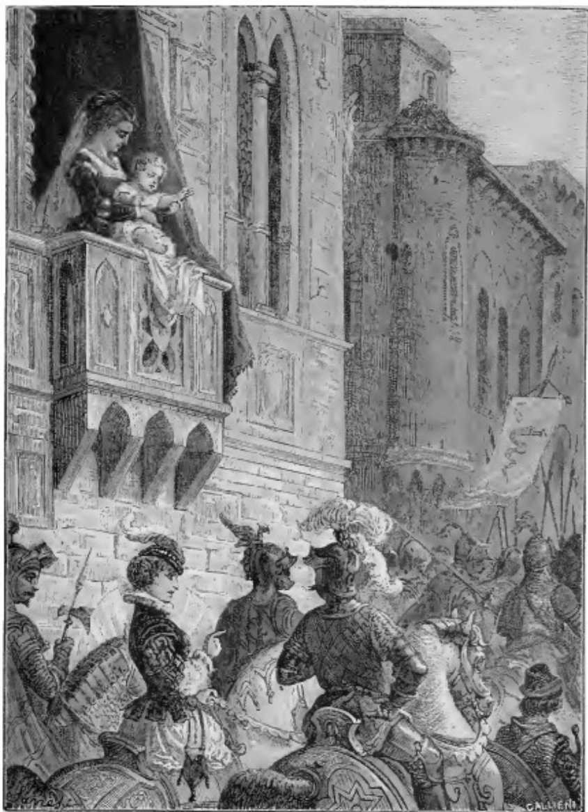
Erasi fatta ad osservare il corteggio, ....