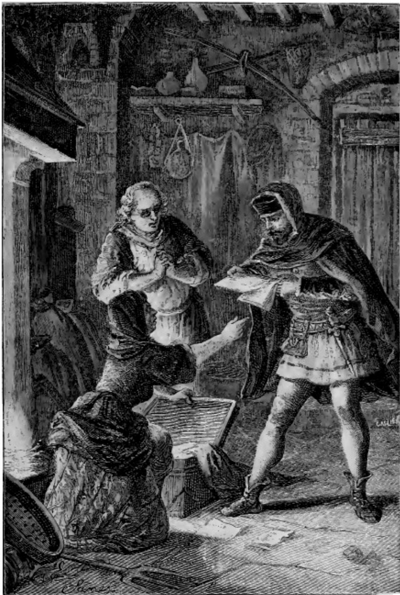
In quelle carte Ramengo cercava, ....