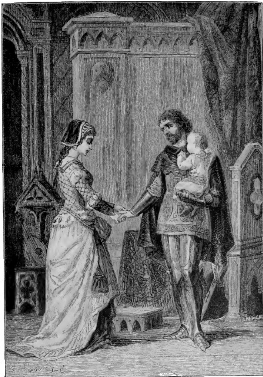
Francesco le stringeva la mano amorevolmente, ....