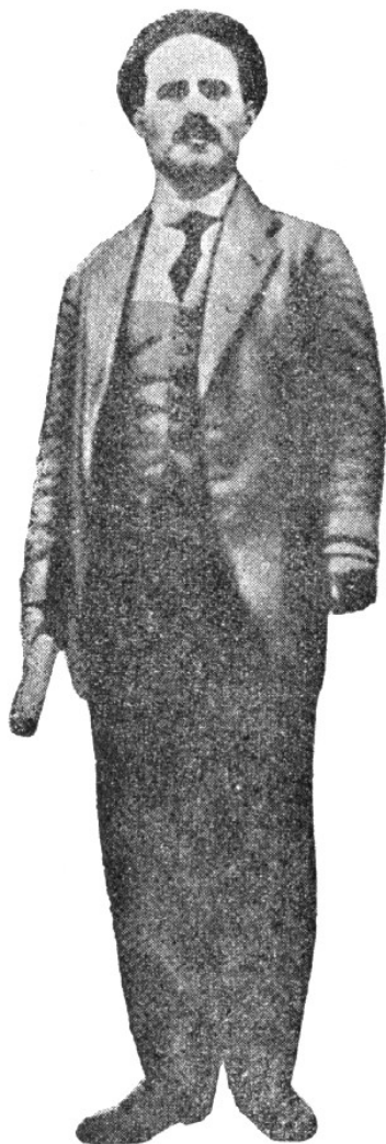
NESTOR IVANOVIC MACHNÒ